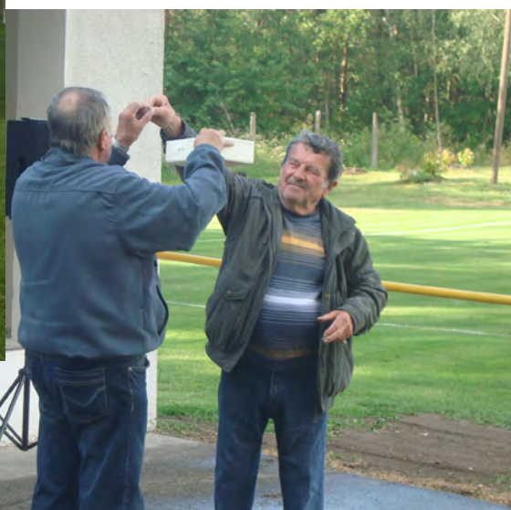
záběr z poločasu - losování výherních zpravodajů

Další novinkou bylo zahájení práce s mládeží formou sportovního kroužku, který byl otevřen jak pro chlapce tak i děvčata.