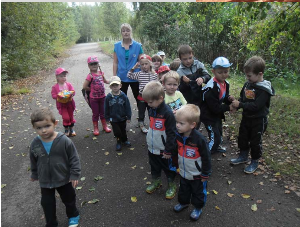
... na jedné z prvních procházek.