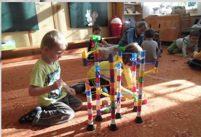
... první hry ve třídě ...