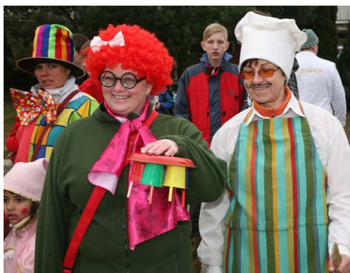
... taneček nastávajícího osmdesátníka