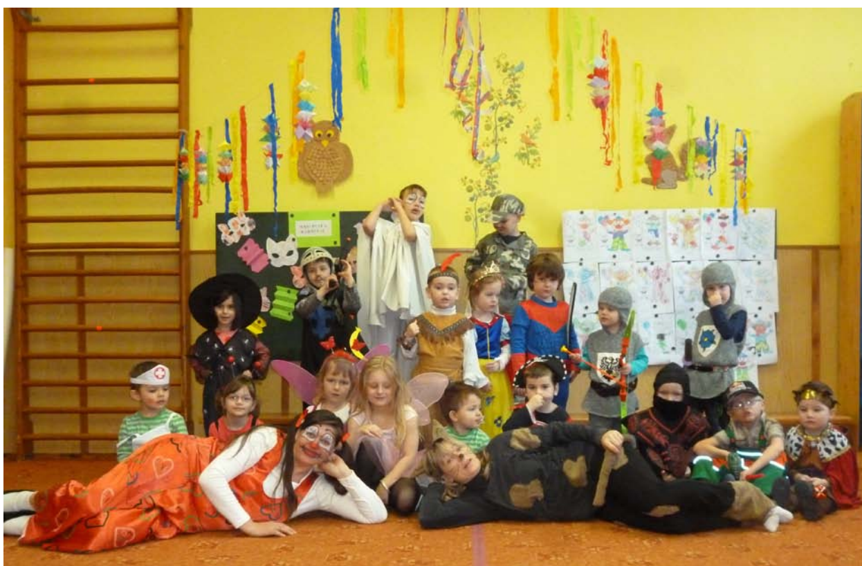
V MŠ Obruby se také každý rok pořádá tradiční „Masopustní karneval“.